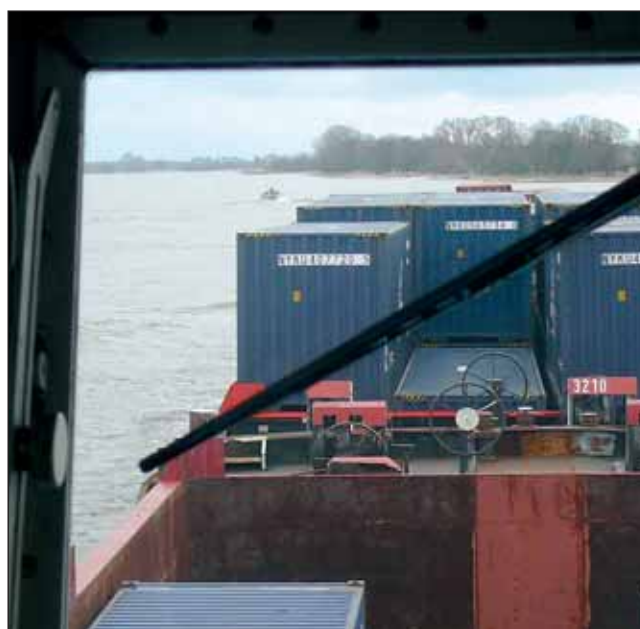
Sicht aus dem Steuerstand eines Berufsschiffes

An Hafeneinfahrten oder Einmündungen besondere Vorsicht! Immer im großen Bogen fahren um ein- oder auslaufende Schiffe rechtzeitig sehen und ausweichen zu können.