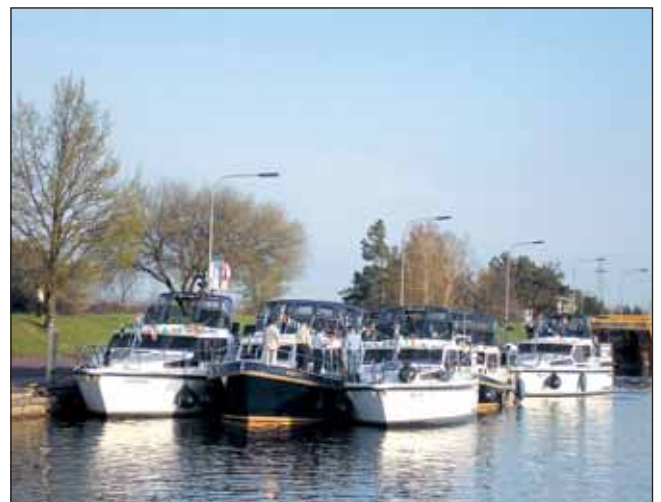
Am Wasserstraßenkreuz Magdeburg

Endlich erreichen wir den großen Fluss. Doch Elbeschippern im Konvoi bei Schiffsverkehr, Gegenstrom und Wind verlangt Aufmerksamkeit, Geduld und Können. Nach einem zweitägigen Aufenthalt in der sehenswerten Landeshauptstadt Magdeburg erhalten alle Skipper noch einmal eine detaillierte Einweisung in das A und O des Elbeschippens, siehe Seite 9. Für Freude beim Fahren sorgen Kenntnisse über Schifffahrtszeichen, das Einhalten der Befahrensregeln und das Beachten der Revierhinweise. Nach ersten Erfahrungen wird es stromabwärts in Richtung Havelberg leichter. Einfach nur fahren und schauen. Mann gefällt das. Frauen sitzen beschäftigt im Salon, denn es regnet immer wieder aus dem Elbehimmel. Derweil schlängelt sich die Flotte elegant mit der Fahrinne über den Fluss. Wetterumschwung. Bei so viel majestätischem Erscheinen schaut zunehmend die Sonne aus den Wolken. Bei Nachmittagssonne erreichen wir Tangermünde.