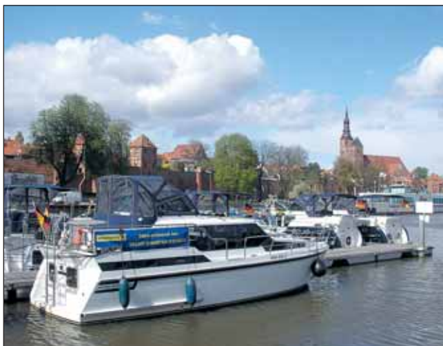
Im Wassersportverein Tangermünde

Wir verlassen die Havel und fahren auf den 56 Kilometer langen Elbe-Havel-Kanal. Dieser wird zusammen mit dem Mittellandkanal im Rahmen des Verkehrsprojektes Deutsche Einheit Nummer 17 zu einer Wasserautobahn ausgebaut. Auf beiden Wasserstraßen fahren vorwiegend Berufsschiffe. Also konzentrieren wir uns auf die Manöver in denen für Sportboote überdimensionierten Schleusen. Da in ihnen Leitern, Poller und Ringe für uns zu weit auseinander liegen, müssen wir mittschiffs mit einer Leine fieren. Entsprechend gehören an die Schiffseite, die an der Schleusenwand liegt, ausreichend Fender. Vorzugsweise Kugelfender an Bug und Achtern. Doch wenn genau an der Schiffseite zur Schleusenwand zu wenige Fender hängen und der Webeleinstek oben drein nicht hält, ergibt das Stress an Bord. Berufsschiffe und Schubverbände sind behäbige Fahrzeuge, die beim Ausfahren aus der Schleuse Zeit brauchen. Dabei sorgen sie für Verwirbelungen. Also lösen wir zunehmend die Leine erst, wenn ein angemessener Abstand sichere Manöver und das verständliche Kommando des Kapitäns es erlauben.