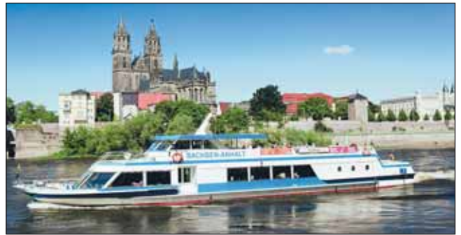
Dom mit Weißer Flotte

Tourist-Information Magdeburg , Ernst-Reuter-Allee 12, 39104 Magdeburg, Tel. 0391 / 83 80 403, www.magdeburg-tourist.de , info@magdeburg-tourist.de