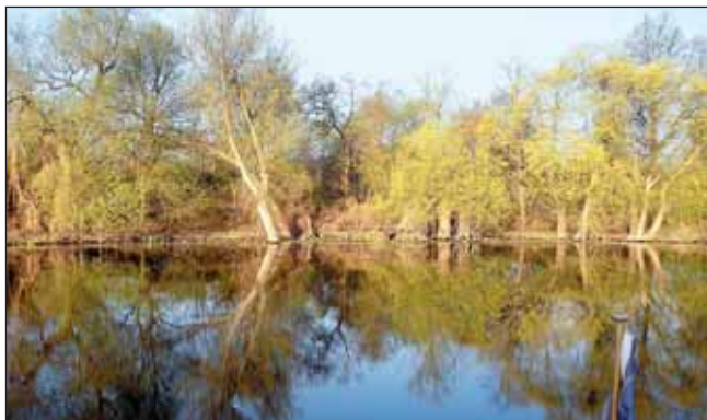
Naturschauspiele auf der Havel