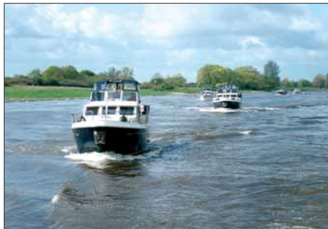
Fahrt auf der Elbe

Grundsätzlich haben Fähren Vorfahrt! Das Besondere: Auf der Elbe gibt es Gierseilfähren. Sie sind an langen Seilen im Flussbett verankert und nutzen die Strömung zum Überqueren des Flusses. Gelbe Bojen im Wasser – auch Buchtnachen genannt – kennzeichnen die genaue Lage des Seils, sie dürfen nicht gekreuzt werden.